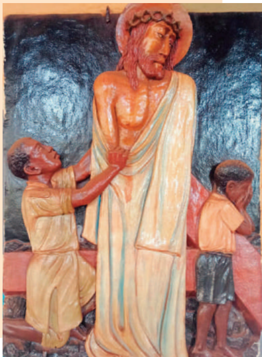
© BR. THOMAS FISCHER CMM [KENIA]