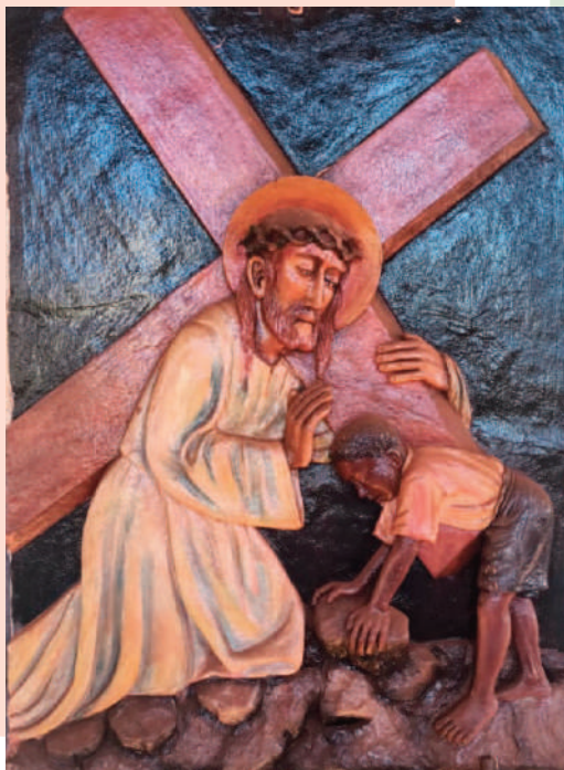
© BR. THOMAS FISCHER CMM [KENIA]