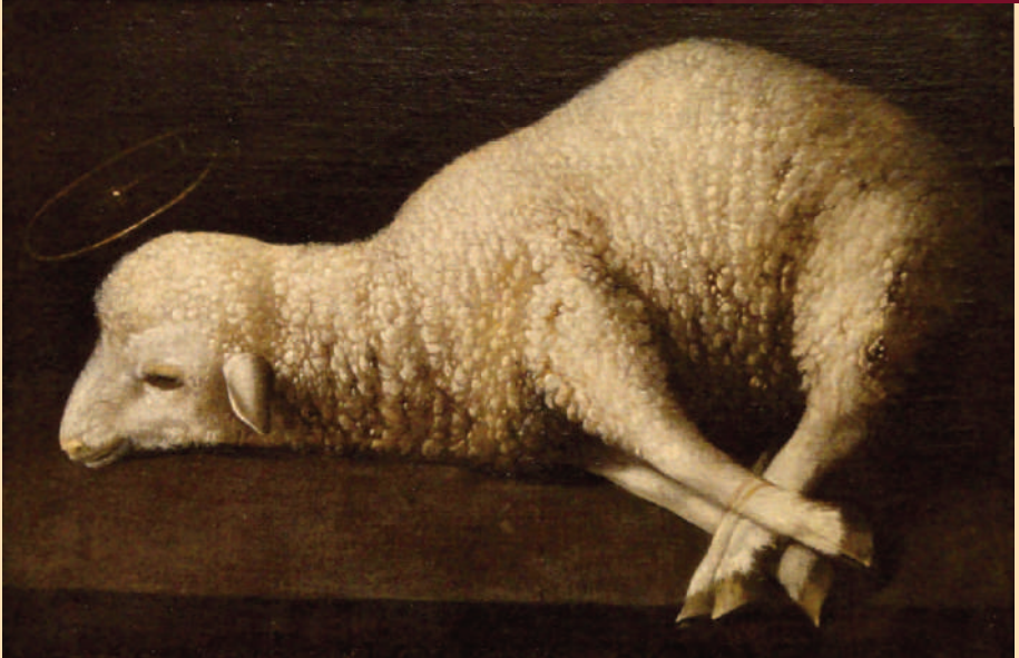
“AGNUS DEI”. ZURBARÁN, 1639, REAL ACADEMIA DE BELLAS ARTES DE SAN FERNANDO, MADRID [SPANIEN]