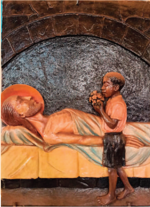
© BR. THOMAS FISCHER CMM [KENIA]