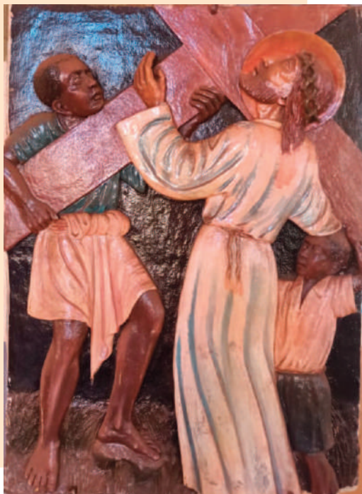
© BR. THOMAS FISCHER CMM [KENIA]