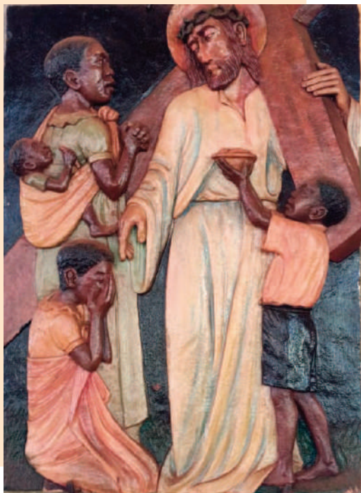
© BR. THOMAS FISCHER CMM [KENIA]