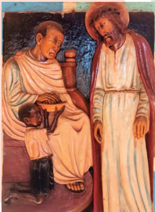
© BR. THOMAS FISCHER CMM [KENIA]