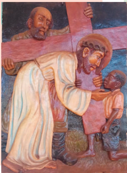
© BR. THOMAS FISCHER CMM [KENIA]