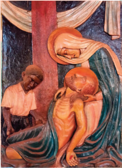
© BR. THOMAS FISCHER CMM [KENIA]